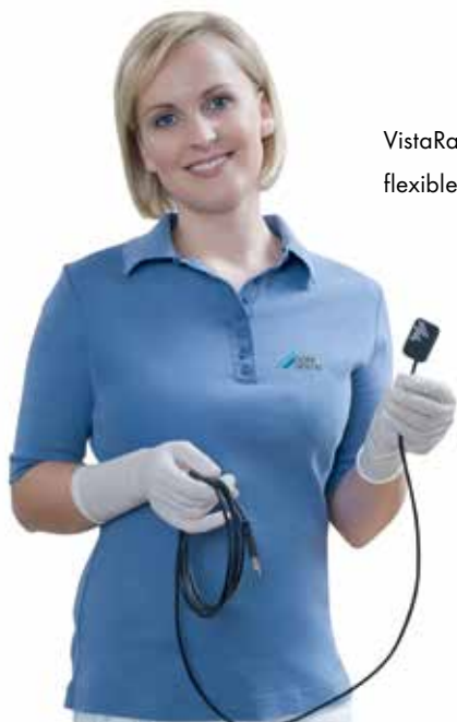
VistaRay 7 con USB: flexible y móvil

La moderna tecnología CMOS del VistaRay 7 garantiza una rápida retransmisión de la imagen con una gran resolución. La nueva capa de escintilador de Dürr Dental reduce la dispersión de la luz mientras la concentra, lo cual tiene un efecto positivo sobre la calidad de la imagen.